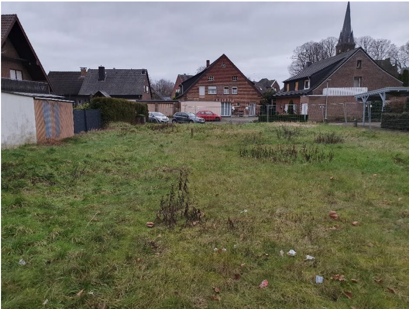
Blick auf die Planfläche von Nordwesten.