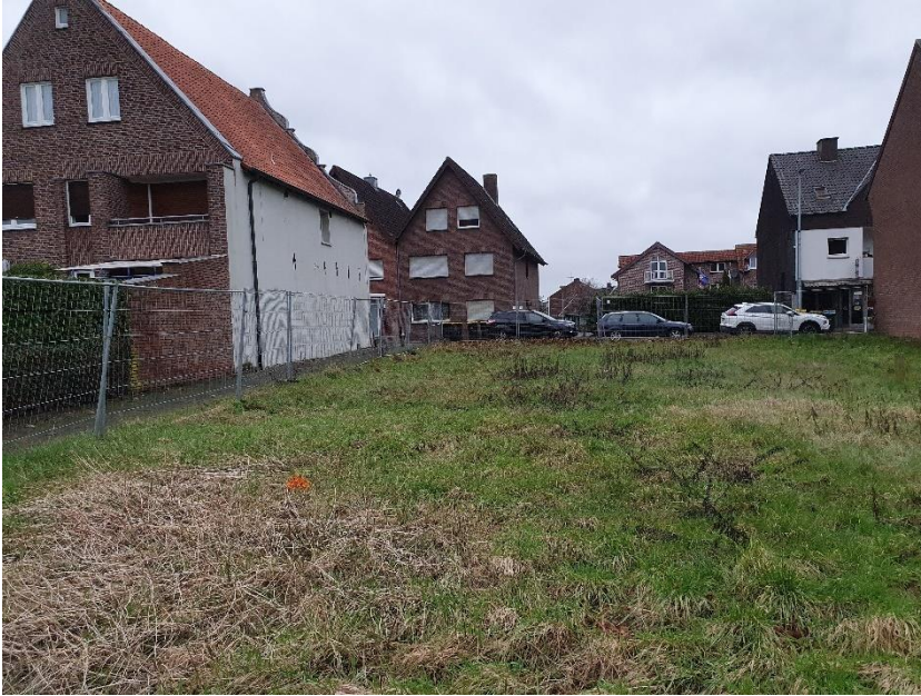
Blick auf die Planfläche von Südosten