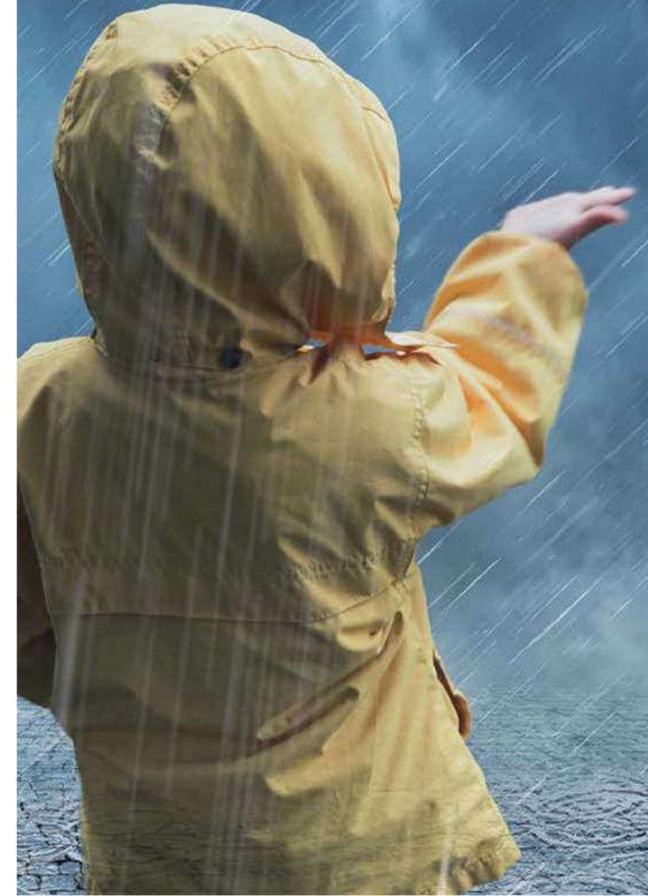
© Kommunal Agentur NRW 08/2016, © Fotos: fololia.de: Cara-Foto, eugeneseregev, tae-smileland, animaflorea, G. Sanders, Zerbor, E. Pokrovsky

Hinweise und Empfehlungen zum Schutz für sich und andere